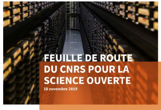
Feuille de route Science ouverte CNRS Novembre 2019

Mobiliser tous les acteurs Dynamique durable, européenne et internationale → Soutien à RDA France et à RDA